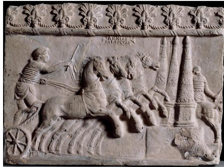
Terracotta plaque, Italy (40–70 AD). The British Museum, London. Greek and Roman department,