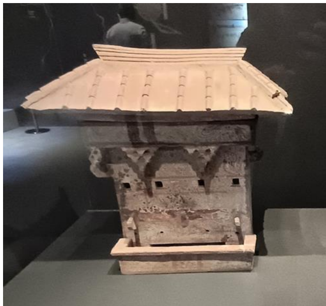
b.西漢「彩綉房型陶倉」