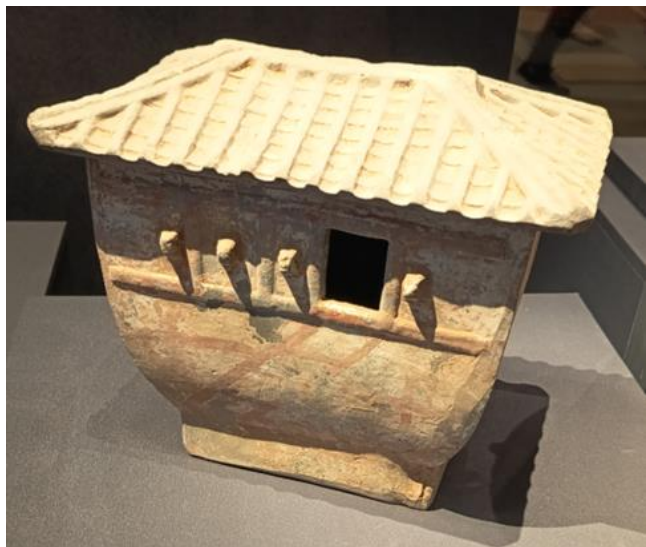
a.西漢「彩綉房型陶倉」