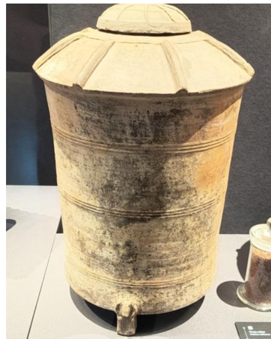
c.西漢「彩綉陶困」照片」